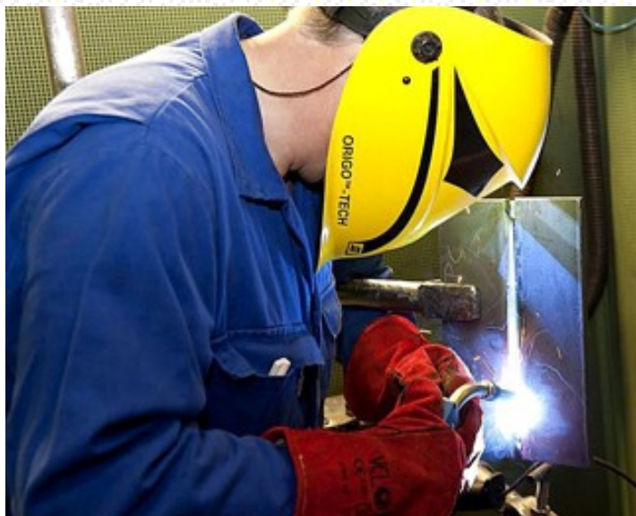
Terwijl de ontwikkeling voor een nieuwe internationaal aanvaarde ISO 9606-1 verder gaat, wordt een nieuwe versie van de huidige EN 287-1 ingevoerd