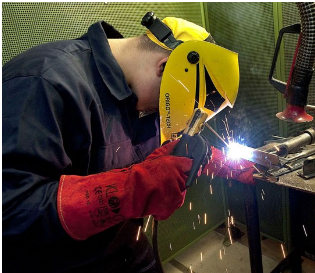
In België werd de EN287-1:2011 in september 2011 reeds overgenomen

een hoeklas, maar door een extra proefstuk samen met de kwalificatie van de stompe las kan gekwalificeerd worden. De overige wijzigingen zijn eerder klein en de actuele lasserskwalificaties kunnen verlengd worden